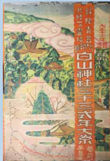
「大正15年白山神社三十三式年大祭ポスター」 個人蔵