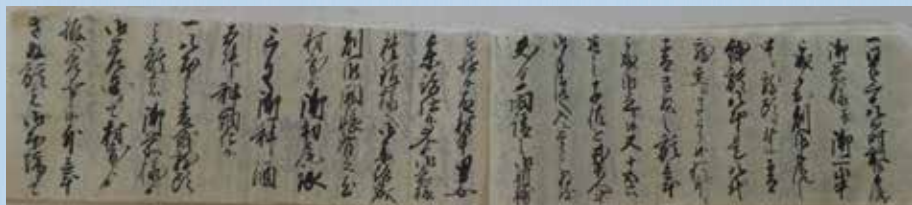
『権現様於御宝雨請一卷』 平泉寺区所蔵