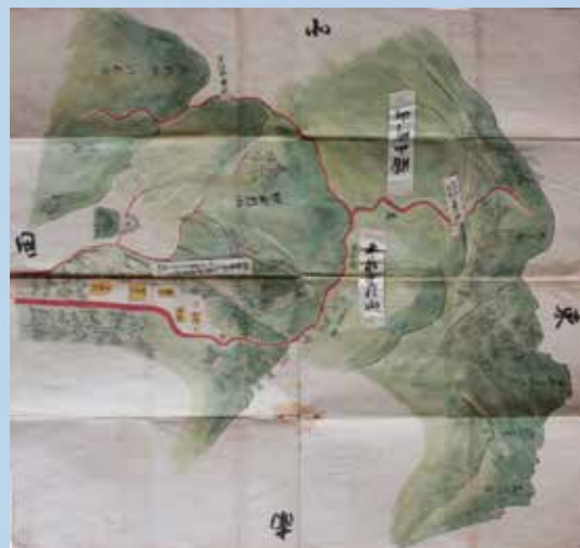
「平泉寺村と四至内七ヶ村山論絵裁許図 写し」 平泉寺区所蔵