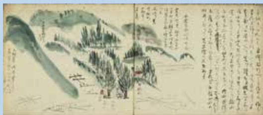
『平泉寺参詣之記』 早稲田大学図書館所蔵

令和7年5月、白山神社では三十 三年ぶりに本社などの開帳が行われ ます。これを受けて本展では、江戸 時代以降の文書や絵図を展示し、平 泉寺開帳の歴史やそのにぎわいの様 子についてご紹介します。また、後期 では、江戸時代以降の紀行文から、 白山登山の道のりや、登頂の様子を はじめ、服装や持ち物など、当時の 人びとがどのように白山に登っていた のかをご紹介します。