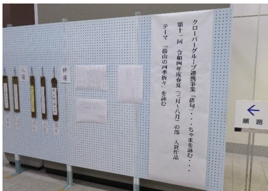
一階展示会場(秋冬の部)

主 旨 勝山市内の4館の文化施設の連携協力事業として始まった俳句事業は第11回、12回目を迎え、今年度は春・夏の部106句、秋・冬の部93句 合計で199点の投句がありました。各部とも入賞作は特選3点、入選6点を選考し、1カ月ごとに順次4館で展示いたしました。