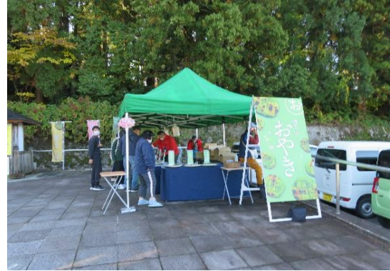
勝山おやき祭り会場