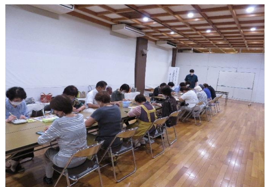
九谷焼絵付け体験